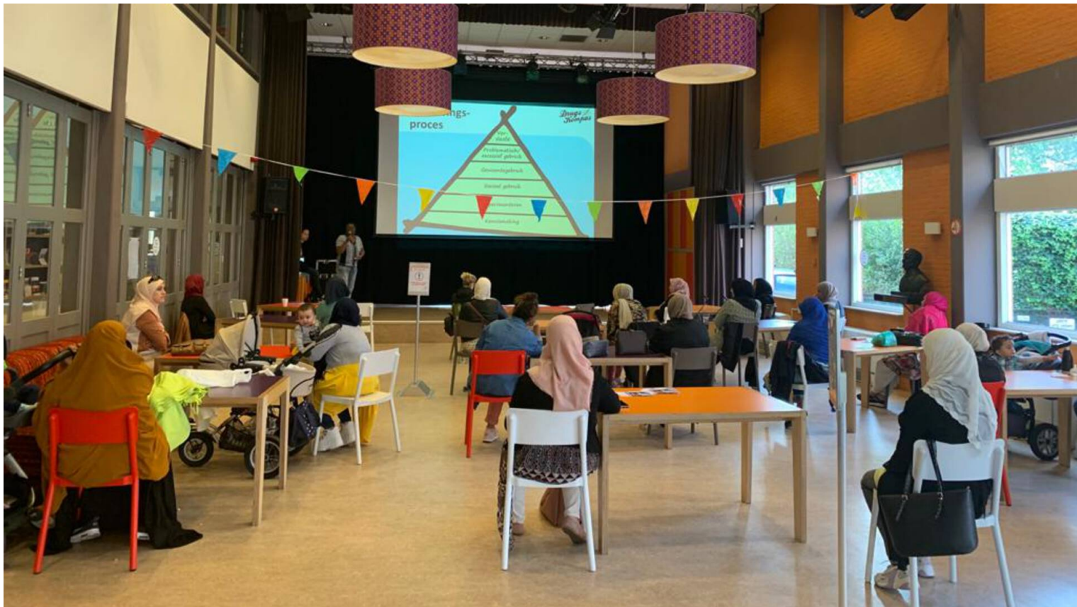
Een bijeenkomst bij buurtcentrum De Mussen